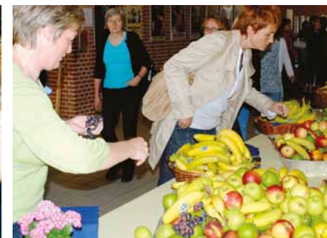
De fremmødte til informationsmøderne kunne frit forsyne sig med frugt og vand.