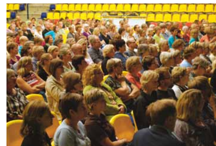
Ca. 1400 medarbejdere mødte op til de to informationsmøder om sundhedsordningen.

Allerede inden informationsmødet gik i gang, var der kø hos behandlerne i forhallen, hvor deltagerne kunne stille spørgsmål og booke tider til behandling. Og hallen var fyldt godt op på begge møder. Omkring 1400 medarbejdere lagde vejen forbi Silkeborg Hallen i løbet af dagen, hvoraf 287 bookede tid til behandling.