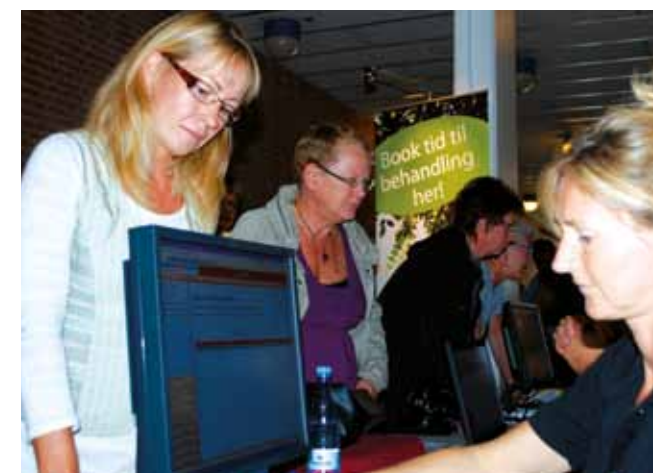
Der var lang kø ved pc'erne, hvor behandler og hjælp med tidsbestilling og besvarede spørgsmål om tilbuddene. I løbet af dagen blev der booket omkring 300 tider til behandling, og HealthCare Danmark fortæller, at der nu er booket ca. 500 tider.