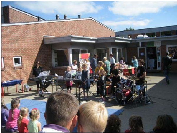
< Potterup, Sorring Skole